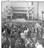
Estudiantil en el gobierno universitario. La manifestación, a la que se sumaron otras a lo largo del país, terminó con violentos incidentes y detención de algunos alumnos.