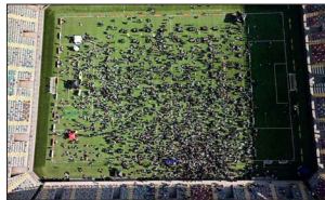
Para llenar el álbum completo, es necesario reunir 980 láminas. Las más buscadas corresponden a Lionel Messi y Cristiano Ronaldo.

denominada "Gran Cambiatión" del álbum futbolero. Esta actividad reunió a coleccionistas de distintas edades y se transformó en uno de los encuentros de intercambio más masivos realizados hasta ahora en