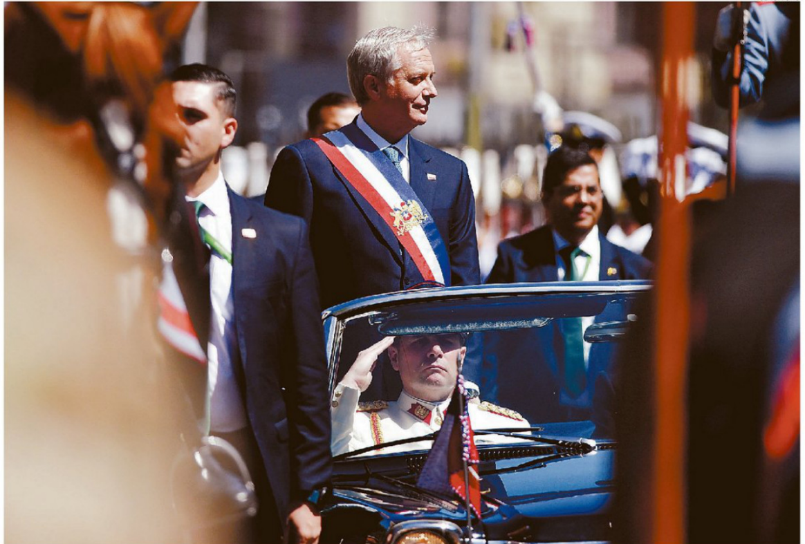
DESDE SOSTENER EL MENSAJE DE CAMPAÑA HASTA RECONOCER ERRORES SON ALGUNAS DE LAS TEMÁTICAS QUE PODRÍAN ABORDARSE EN ESTA PRIMERA CUENTA PÚBLICA DE KAST.

En el caso del segundo gobierno de Sebastián Piñera, recuerda el académico, "la atención estuvo puesta en torno a las diferencias con los logros alcanzados por Michelle Bachelet y la preocupación sobre la situación económica. Por su parte, Gabriel Boric orientó su discurso a las demandas expresadas en el estallido social y las esperanzas que despertaba el pri-