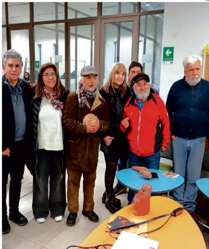
DESTACADO CERAMISTA ESTUVO EN SAN ANTONIO EXPONIEDO SOBRE SU ARTÉ.

"Venir a aportar con la cerámica ha sido muy importante y estamos echando a andar esta carrera que nos ayuda a todos cul-