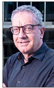
Bernardo Fontaine presidiendo Codelco desde mañana miércoles 27.

Pacheco manifestó en la carta que “como chileno, agradezco la oportunidad que tuve de servir al país desde esta posición. He puesto al servicio de esta tarea toda mi energía, mis capacidades y mi experiencia empresarial y pública. Nunca, nada, me aparté de la responsabilidad que significa ser presidente de la mayor empresa del Estado de Chile, que ha aportado desde su formación en 1971 la cantidad de US$ 164.000 millones (en moneda actual) al erario nacional, y cuenta con más de 75.000 trabajadores propios y externos. Como sucede siempre a quienes ocupan estas posiciones para avanzar e innovar y no simplemente administrar, mi desempeño ha sido objeto de controversias y está abierto a la evaluación pública; pero como señalé en la Junta de Accionistas del pasado 20 de abril, tomamos a Codelco en una situación difícil, y hoy lo dejamos más fuerte, más robusto y con un horizonte que es mejor”.