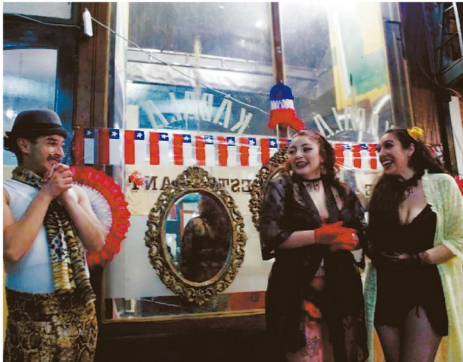
EL TRABAJO EN EL RUBRO ARTÍSTICO SE CARACTERIZA POR SU INTERMITENCIA Y LA ESCASEZ DE VÍNCULOS LABORALES FORMALES.

“En mi caso particular, cotizaciones no tengo. O sea, mañana, pasado, llega la hora de jubilar, y si sigo con esta vida de trabajar en el arte, ganando para el día a día, yo no voy a tener jubilación. (...) Al final, he ahí la frase: voy a hacerlo aunque sea por el amor al arte. La precariedad en el arte tiene muchos flancos