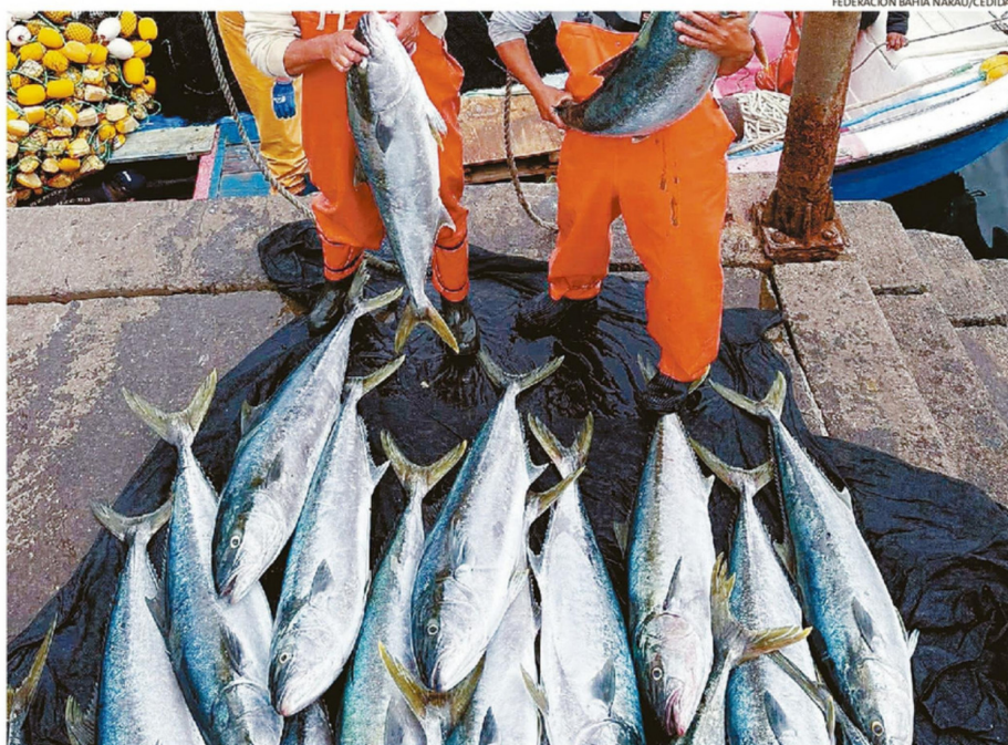
AGRICULTORES, AGROPECUARIOS Y PESQUEROS SON LOS TRABAJADORES CON MAYOR TASA DE INFORMALIDAD EN LA REGIÓN.

PUERTA A PUERTA Históricamente, y tal como en la actualidad, el empleo informal se ha concentrado en dos categorías: trabajadores por