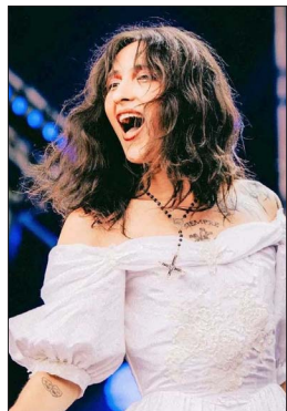
Javiera Electra publicó a finales de 2025 su álbum debut, "Hellade".

En cuanto a próximas presentaciones, el 11 de junio cantará en el GAM, en el "Ciclo Armonía".