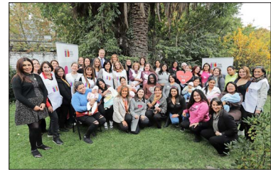
A la fecha, más de 9 mil niños han nacido bajo el Programa de Acompañamiento Integral a Mujeres con Embarazos Vulnerables de la Fundación Chile Unido.