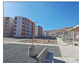
El conjunto habitacional Renacer I de Alto Hospicio fue entregado en marzo, pero a las familias se les invitaba a una ceremonia de entrega el 19 de mayo.

las familias. Apenas tomamos conocimiento de esta situación, junto a la directora (s) de Serviu informamos sobre la falsedad de la supuesta entrega de viviendas anunciada para el 19 de mayo, en un conjunto habitacional que ya fue inaugurado en marzo pasado. La denuncia fue ingresada el lunes 4 de mayo y este jueves (ayer) sostuvimos una reunión con la fiscal regional para complementar la información inicial”, dice. La estafa se habría concretado valiéndose de los cupos que quedaron sin completar por personas que no cumplieron los requisitos. Se trataría de tres plazas, no obstante, la denuncia da cuenta que 38 familias habrían transferido montos de al menos $6 millones, y otras cientos de personas habrían entregado montos menores para una posterior postulación.