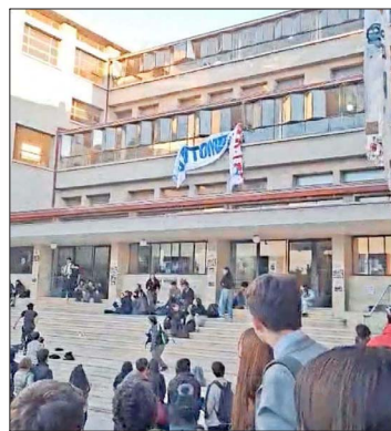
ATAQUE. — En un video difundido en redes sociales se observa el ataque de los manifestantes que sacan el lienzo y amedrentan a estudiantes en la Facultad de Derecho.