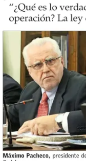
Máximo Pacheco, presidente de Codelco.

Una tensa sesión tuvo la comisión de Minería y Energía de la Cámara de Diputados ayer, en un encuentro al que estuvo invitado el presidente del directorio de Codelco, Máximo Pacheco, para hablar del estado financiero de la compañía estatal. Varias discusiones se produjeron a lo largo de la sesión, con duros intercambios entre Pacheco y el presidente de la comisión, el diputado Cristián Tapia (bancada PPD-Independientes). Algunas de las recriminaciones fueron por temas menores; por ejemplo, si la minera había recibido o no el documento resultado de la comisión investigadora a Codelco por un accidente fatal ("me parece insolito", dijo Tapia), o si Pacheco se había excusado de una o dos invitaciones de la comisión (se le pidió al secretario que revisara el acta). Uno de los más duros intercambios se dio en torno a la chimenea de la fundición de Potrerillos, que sufrió un colapso el año pasado. "Es una fundición que tiene un tremendo desafío para adelante, y no va a ser capaz de cumplir con las nuevas normas ambientales", comenzó