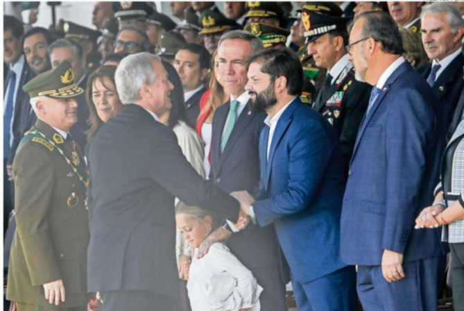
EL MANDATARIO ANUNCIÓ UN PAQUETE DE MEDIDAS PARA PROTEGER Y APOYAR A FUNCIONARIOS Y SUS FAMILIAS.

Durante la ceremonia, el Presidente también recordó a los tres carabineros asesinados en 2024 en Cafete justo para esta fecha y anunció un paquete de medidas