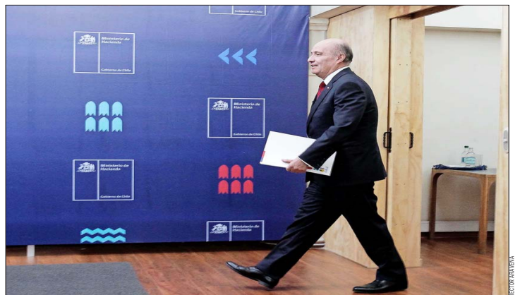
El ministro de Hacienda, Jorge Quiroz, destacó la gradualidad en la propuesta de reintegración del sistema.

tributaria del Colegio de Contadores, Juan Alberto Pizarro, apoyó la idea. “La reintegración total del régimen de impuesto renta es una medida clave para una mayor eficiencia y simplicidad de nuestro sistema tributario. Al eliminar la restitución parcial del crédito de impuesto de primera categoría, removemos una distorsión que hoy castiga a casi 100.000 pymes forzadas a tributar como grandes empresas”, asegura.