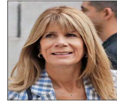
Ximena Rincón, ministra de Energía.