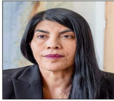
Ximena Lincolao, ministra de Ciencia.

Francisco Pérez Mackenna El jefe de la cartera de Relaciones Exteriores anotó 19 participaciones en el ítem de comunidades, sociedades y empresas. También incluyó cuatro cuotas