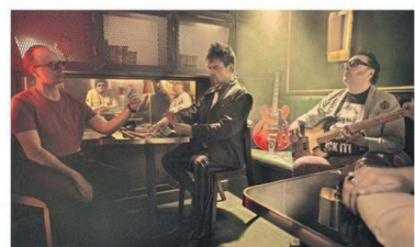
En julio pasado, los integrantes iniciales grabaron en Abbey Road.

Garvo indicó que buscaron explorar el Chile profundo, a través de un personaje que, "al estilo de un joven Roberto Parra", recorre paisajes con el corazón roto. "La estética se inspira en el arte popular y los grabados para construir una identidad visual propia desde la animación", dijo.