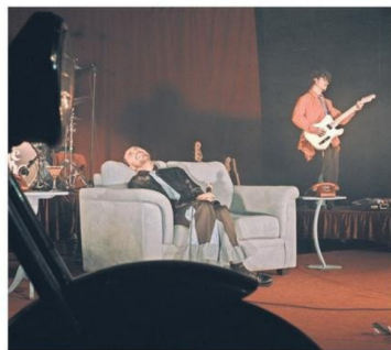
Las dramatizaciones son parte de la propuesta escénica del ellos.