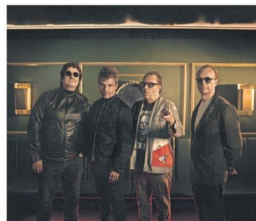
La formación original no lanzaba discos desde agosto de 1999.

El disco contó con Alvaro Henríquez como productor principal,