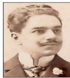
El arquitecto Ricardo Larraín Bravo dejó en Santiago una dúctil obra arquitectónica.

Una vez elaborado el diagnóstico final, la idea es generar una coordinación con la institucionalidad patrimonial, en particular el Consejo de Monumentos Nacionales, para trabajar una estrategia adecuada de restauración del templo. Los prolijos planos de Larraín Bravo, guardados durante casi un siglo en un rincón del templo de los Sacramentinos, serán ahora clave para comprender la evolución constructiva del edificio y emprender el ansiado camino para su completa restauración, que ha tardado tantos años.