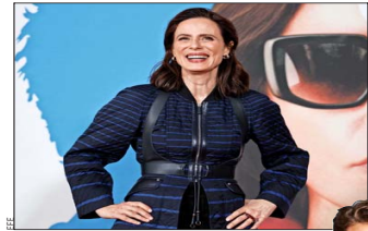
La actriz en marzo pasado durante la presentación de "Amarga Navidad", de Pedro Almodóvar.