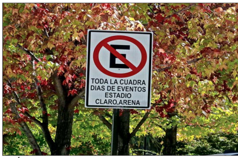
VEHÍCULOS.—Vecinos de la zona reclaman por la gran aglomeración de automóviles que ocurre en las cercanías al estadio durante cada evento.

El historial de estos encuentros reactiva temores por congestión, seguridad y alteraciones en la vida del barrio. Residentes definen el estadio como "un vecino molesto".