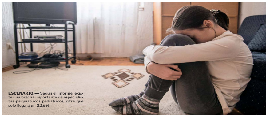
ESCENARIO.—Según el informe, existe una brecha importante de especialistas psiquiátricos pediátricos, cifra que solo llega a un 22,6%.

El informe indica que si bien en el sistema privado no se observa una demanda creciente de atención, esto no implica la disminución de la prevalencia "si no más bien puede ser indicativo de una atención de personas por debajo de las necesidades, pero por diversos motivos (gasto de bolsillo, estigma, falta de oferta) las personas que la necesitan no están accediendo a ella".