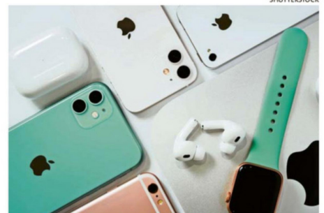
LOS PRODUCTOS DE APPLE SON RECORDADOS POR SUS DISEÑOS.

Este camino fue pavimentado mediante la aparición del computador Macintosh en 1984, que introdujo la informática personal a las masas, hasta el iPod en 2001, que cambió el consu-