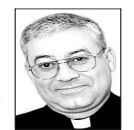
JUAN IGNACIO GONZÁLEZ ERRÁZURIZ Obispo de San Bernardo

En este contexto, se vuelve necesario que cada persona y cada familia revisen sus hábitos de consumo. Es una ocasión propicia para preguntarse, con sinceridad, cuántos gastos de más realizamos habitualmente y cuántos ahorros podríamos alcanzar si adoptáramos una visión menos consumista y más solidaria. Muchos gastos que hemos considerado normales pueden ser postergables o incluso prescindibles. Este ejercicio, lejos de ser solo una imposición externa, puede transformarse en una oportunidad para redescubrir un estilo de vida más sobrio, consciente y fraterno.