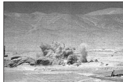
toneladas de material estéril que parte de 60 millones de toneladas que será necesario extraer para llegar a la roca mineralizada de cobre. El yacimiento comenzará a producir a mediados de 1998.

PRIMERA TRONADURA. Con la presencia de ejecutivos del cobre se inició la fase productiva en la mina Radomiro Tomic, 15 kilómetros al noroeste de Chuquibambilla. En la jornada fueron removidas 220 mil toneladas de material estéril como parte de 60 millones de toneladas que será necesario extraer para llegar a la roca mineralizada de cobre. El yacimiento comenzará a producir a mediados de 1998.