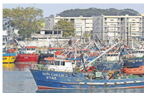
Podrán optar al beneficio embarcaciones de 12 metros de eslora.

frente a la estructura de gastos de una faena pesquera. "El combustible representa uno de los principales insumos y su variabilidad impacta directamente la rentabilidad diaria. En ese contexto, $100 mil mensuales difícilmente compensan incrementos sostenidos en el precio del combustible. Un pescador artesanal con bote a motor, como promedio diario de consumo de combustible es el monto indicado como subsidio por parte de la autoridad", dijo. En esa línea, el dirigente agregó que condicionar el acceso al aporte a quienes registraron actividad durante 2025 y a la operación efectiva en el mes de postulación, "introduce un sesgo que podría excluir a pescadores que,