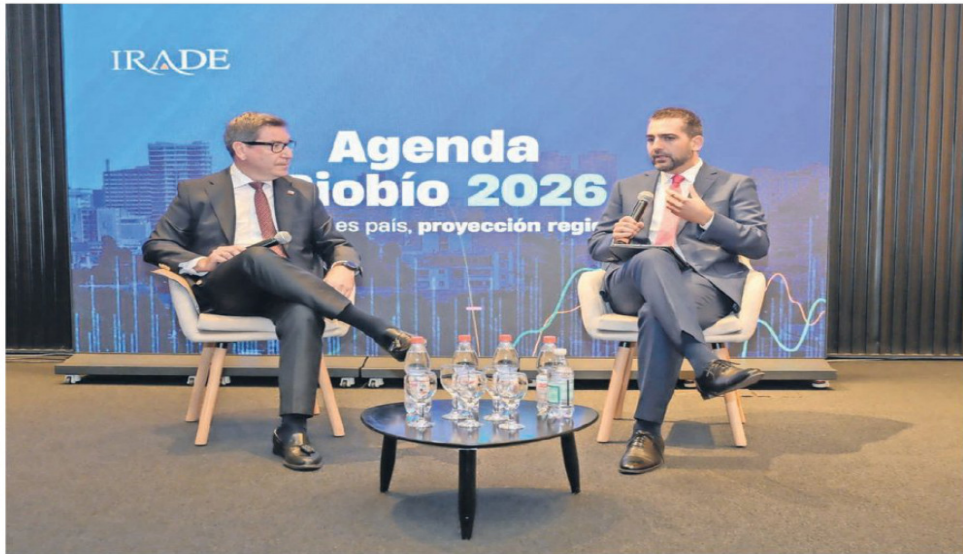
El secretario de Estado sostuvo que buscarán integrar las distintas miradas productivas de la Región para plasmarlas en el plan.

Consultado por los objetivos para Biobío, Mas detalló que durante su primera reunión en la zona con el gobernador regional, Sergio Giacaman, abordaron cómo integrar las distintas miradas para así plasmarlas en el Plan Bio-