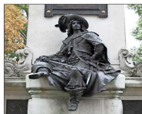
Escultura de d'Artagnan en París. El rey Luis XIV encargaba al mosquetero misiones secretas, y asuntos de Estado delicados, además de temas de espionaje.

En el esqueleto hay restos compatibles con ese proyectil en la zona torácica, lo