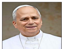
El Pontífice también alentó la investigación científica.

"En mascotas mayores pueden ser beneficiosos, porque tienen mayor desgaste y problemas de absorción de nutrientes", explica Reyes.