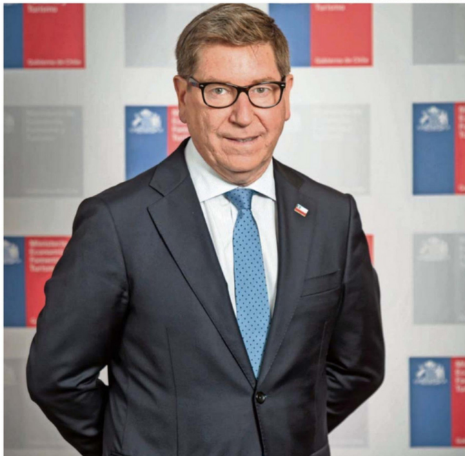
SECRETARIO DE ESTADO ASUMIÓ EL 11 DE MARZO Y ESTARÁ SÓLO HOY EN LA COMUNA DE VALDIVIA.

-Nuestra prioridad absoluta es generar una auténtica economía del progreso que se sienta en cada rincón de Chile, pasando de un crecimiento mediocre a uno potente y sostenido. Para lograrlo en las regiones, estamos impulsando un robusto plan de incentivos que incluye la reducción del impuesto corporativo hasta alcanzar una tasa del 23% al final de nuestro mandato, devolviéndole competitividad a nuestras industrias locales. Además, estamos estudiando la reincorporación de herramientas de certeza jurídica, similares al histórico DL600, para que la inversión nacional y extranjera vuelva a despegar con reglas claras y estabilidad tributaria. Queremos eliminar el "freno de mano" que representa el impuesto a las ganancias de capital, trans-