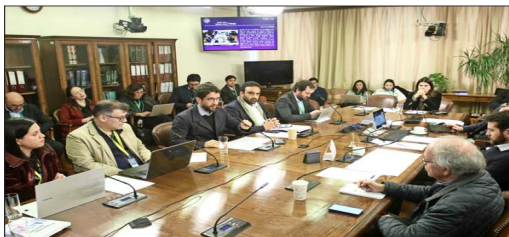
En la segunda semana de enero el Ejecutivo ingresó el proyecto de negociación multinivel para que se empezara a discutir en la comisión de Trabajo de la Cámara.