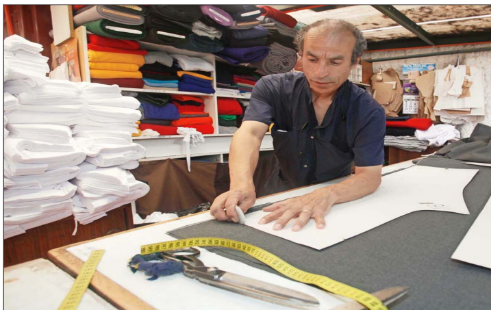
El deterioro del mercado laboral ha golpeado, especialmente, a las micro y pequeñas empresas que tienen hasta 49 trabajadores.

Especialistas calculan que al trimestre septiembre-noviembre de 2025 en estas firmas de menor tamaño se destruyeron 74.984 puestos de trabajos asalariados formales.