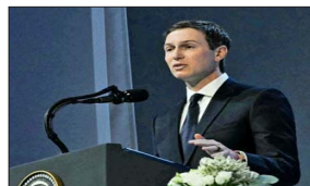
Jared Kushner, empresario y yerno de Donald Trump, presentó un cronograma para reconstruir Gaza, en el marco del "Consejo de Paz" que promueve el mandatario estadounidense.