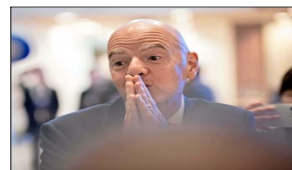
El presidente de la Fifa, Gianni Infantini, apareció ayer en la cumbre.

Aprovecho para compartir el haber tenido la oportunidad de conversar sobre