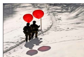
Soldados recorrían las inmediaciones del encuentro en Davos llevando globos rojos.

Chile con personas que tienen inversiones en nuestro país, y otros que prestan servicios profesionales a los empresarios criollos y sus empresas en la región. Hay varios motivos para estar orgullosos de nuestro país y para estar optimistas sobre el futuro. En primer lugar, Chile es todavía percibido como la nación con la estructura institucional más estable y fiable para hacer inversiones en todo el continente latinoamericano. Y en segundo lugar, se le reconoce a nuestro país el tener una sociedad con un nivel de educación y capacidades que está muy por encima de las otras partes. De hecho, esta gente ya no asocia a Chile con las realidades político-económicas que son típicas (en el sentido negativo) de la noción de América Latina.