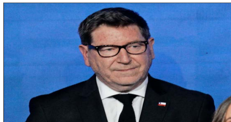
BIMINISTRO DE ECONOMÍA, FOMENTO Y TURISMO, Y MINERÍA

Más allá de la normativa, la cartera puede asumir un rol clave como articulador de la colaboración público-privada, un aspecto donde Mas corre con