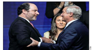
MINISTRO DEL TRABAJO Y PREVISIÓN SOCIAL

Juan Bravo plantea dos necesidades: "El actual mecanismo de indemnización por años de servicio genera una serie de distorsiones en las relaciones laborales, desincentiva la generación de empleo asalariado formal en el sector privado y re-