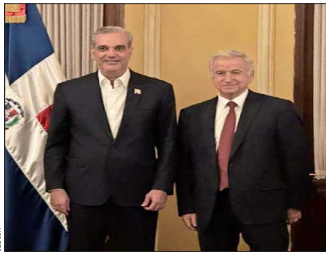
El Presidente de República Dominicana, Luis Abinader, junto a Felipe Larraín.