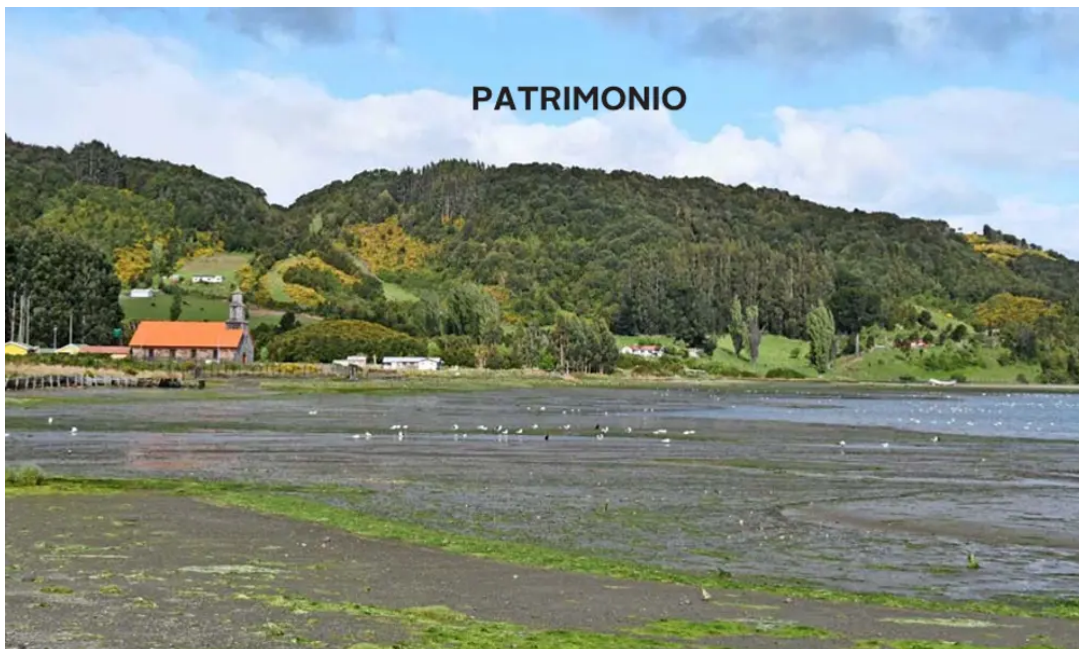
Capilla de Chullec, en el paisaje de Quinchao; en octubre se realiza la fiesta religiosa en honor a María Auxiliadora.