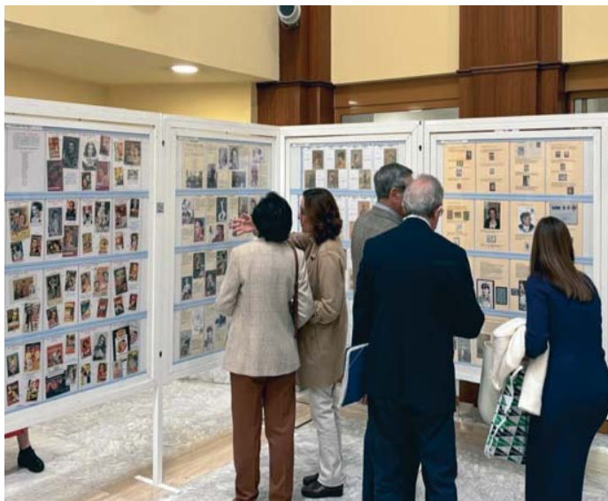
Imagen del público asistente a la exposición abierta en la oficina de Correos de Cádiz.