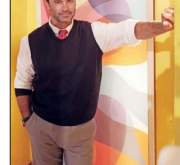
Karén Doggenweiler y José Antonio Neme, los conductores de matinal líder, "Mucho Gusto".