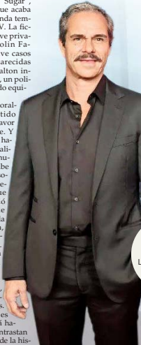
Tony Dalton recientemente apareció en "The Last of Us" como el padre de Pedro Pascal.

La mayoría de las escenas de Dalton en la ficción son con Colin Farrell. "Fue fantástico trabajar con él, es Last of Us" como el padre de Pedro Pascal, por los últimos 25 años y tener la oportunidad de compartir este importante momento. Es un gran tipo, muy profesional, un verdadero ejemplo a seguir", finaliza.