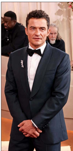
Orlando Bloom en la pasada gala de los Globos de Oro. Pronto estrenará la nueva película de Werner Herzog.

De hecho, "Deep cover" es su más reciente estreno, una comedia sobre un grupo de actores fichados por la policía londinense. Además, aún espera estrenar otra comedia, "Wizards", de David Michôd ("Reino animal"), donde actúa junto a Pete Davison y Naomi Scott. También, el año pasado rodó "Bucking fastard", de Werner Herzog, un drama prota-