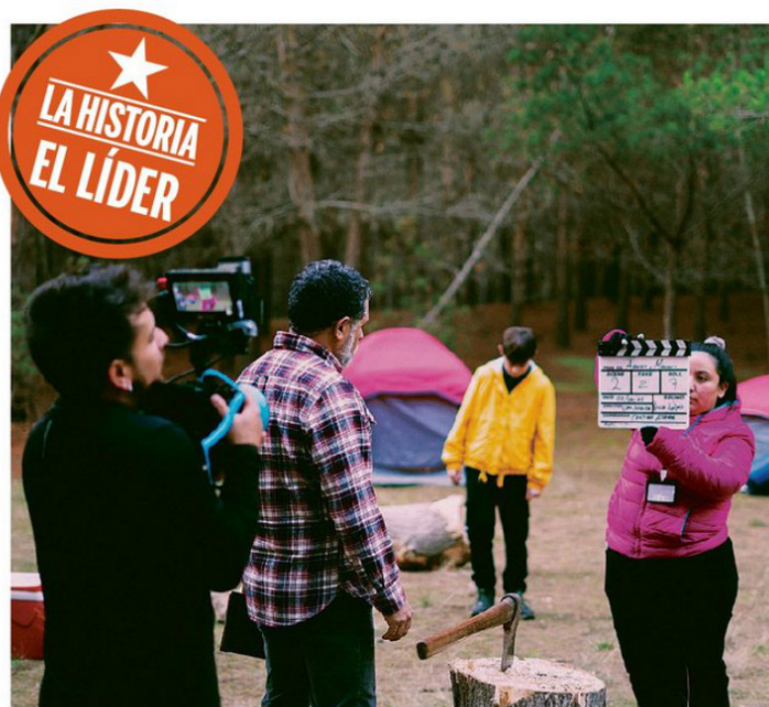
EL CORTOMETRAJE CUENTA LA HISTORIA DE NOAH, UN NIÑO DE 12 AÑOS, JUNTO A SU PADRE.

se realizó el cortometraje "Herencia", cuya productora ejecutiva y general es una sanantonina.