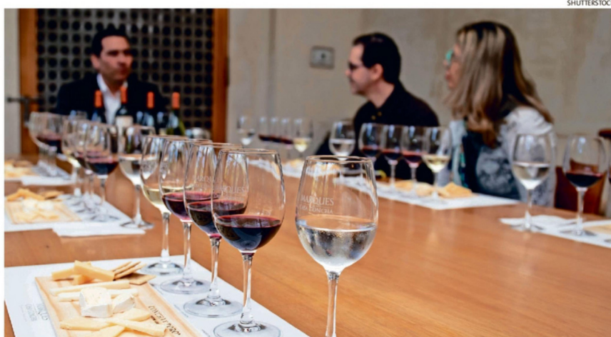
EL ENOTURISMO HA SIDO UNA ESTRATEGIA PARA CONTRARRESTAR LA CAÍDA EN LAS VENTAS.

En Chile, la producción bajó 10% en 2025, mientras que la superficie cubierta por viñas se ha reducido un 27% desde 2019, indicó a agencia EFE el Ser-