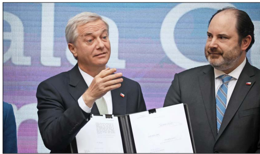
El Presidente José Antonio Kast y el ministro del Trabajo, Tomás Rau, firmaron ayer las indicaciones al proyecto de sala cuna.