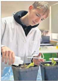
Estudiante aplica biofertilizante a una planta de lechuga en laboratorio, con el objetivo de estimular su crecimiento vegetativo, mejorar su calidad y fomentar prácticas sostenibles.

Esta propuesta cobra especial relevancia al considerar el estudio realizado en el año 2024 por la Universidad de Talca, que reveló que más del 25% de las frutas y hortalizas analizadas en la región superan los límites permitidos de residuos químicos. Esto representa un riesgo grave tanto para los consumidores como pa-