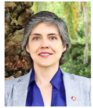
En materia de IA, la influencia (...) muchas veces aparece en informes técnicos, financiamiento de estudios o propuestas normativas".