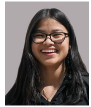
Lo que vemos se parece cada vez más al manual que usó la industria del tabaco, pero operando a mayor velocidad y escala".

El diagnóstico es compartido: la participación de la industria en el debate regulatorio es legítima, pero debe responder a un equilibrio y no a una intromisión sin control. Todos los países tienen el desafío de legislar antes de que sea tarde, lo que no siempre se logra; y hoy se abre una oportunidad para que Chile pueda adelantarse a que el lobby llegue a las actuales escalas borsales.