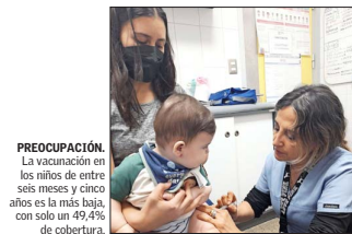
PREOCUPACIÓN. La vacunación en los niños de entre seis meses y cinco años es la más baja, con solo un 49,4% de cobertura.

Comenta que si bien hoy existe un marco normativo por la ley integral de cuidados, "se debe avanzar en el registro de cuidadoras, mejorar subsidios y fortalecer programas de capacitación y acompañamiento".