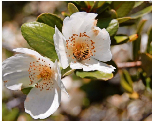
LA FLOR DEL ULMO ES RECONOCIDA POR SU AROMA DULCE.

El proyecto utiliza electrosponning o electrohilado, técnica que permite fabricar nanofibras, es decir, hilos con un diámetro menor a 500 nanómetros, lo que equivale a 0,00005 centímetros. Para tener en cuenta, el pelo humano tiene un grosor promedio