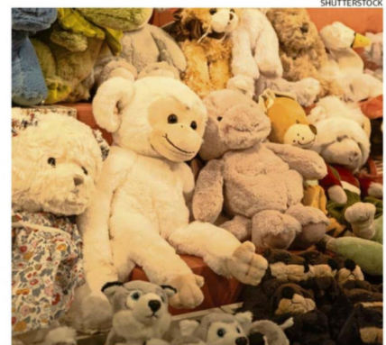
ENTRE 10% Y 15% MÁS ESTÁ COSTANDO FABRICAR MUÑECOS.

Ya van ocho semanas de interrupciones del suministro mundial. Venegas lleva 30 años en la industria del juguete y dijo que, por ahora, absorberá los mayores costos de materiales, pero espera aumentar los precios al público en 2027 si la guerra se prolonga de tres a seis meses más. CS