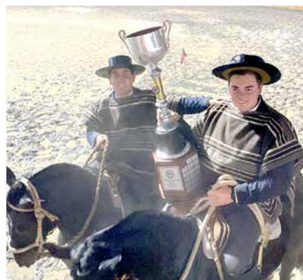
COLLERA DE CURICÓ Y LINARES