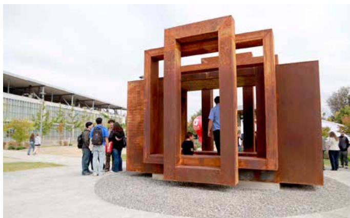
La estructura fusiona la arquitectura y la escultura para brindar un espacio único.