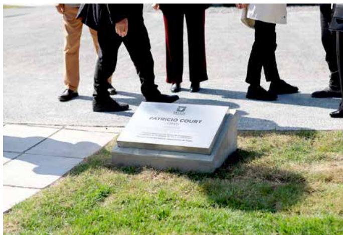
Frente a la estructura, se ubicó la placa que lleva el nombre del autor para recordar en la posteridad dicho momento de inauguración.