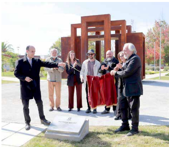
El momento de descubrir la placa fue compartido por el rector de la casa de estudios y el autor de la escultura entre los aplausos de la comunidad.