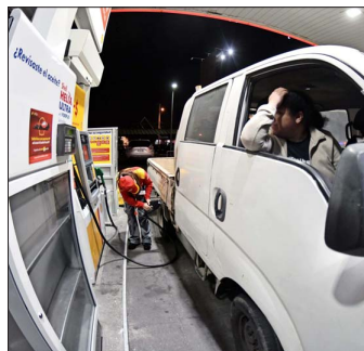
Políticamente , la decisión del Gobierno de José Antonio Kast de traspasar esas alzas del petróleo sin amortiguación ha tenido un costo que se enquistó en una súbita baja de aprobación que, por extensión, los partidos oficialistas también podrían sufrir.

La bancada de diputados oficialistas entregó a Hacienda dos proyectos que buscan neutralizar el componente variable del impuesto específico. Al tratarse de materias de gasto fiscal, requieren iniciativa del Presidente para ingresar al Congreso.