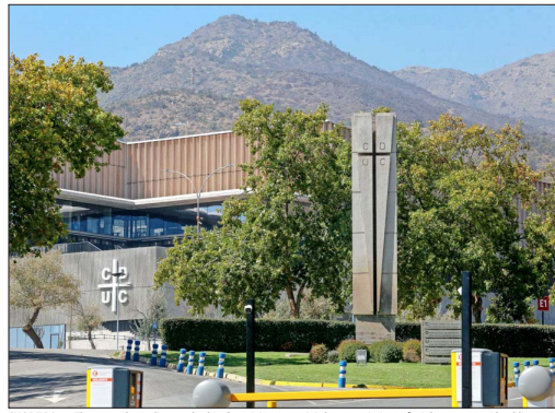
INGRESO.—El acceso al estadio para los hinchas visitantes exigirá reconocimiento facial y presentación obligatoria de pasaporte vigente, con ingreso restringido a horarios y sectores definidos.