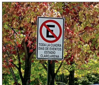
VEHICULOS.—Vecinos de la zona reclaman por la gran aglomeración de automóviles que ocurre en las cercanías al estadio durante cada evento.

El historial de estos encuentros reactiva temores por congestión, seguridad y alteraciones en la vida del barrio. Residentes definen el estadio como "un vecino molesto".