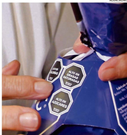
LA LEY DE ETIQUETADO INVITA A LA MESURA EN EL CONSUMO.

Lo primero que hay que mirar es si la caja de huevitos trae sellos negros de advertencia como "Alto en azúcares", "Alto en grasas saturadas" o "Alto en calorías", lo cual "significa que es un producto de consumo ocasional. Mientras menos sellos tenga, mejor", señaló el organismo de la Universidad de Chile.