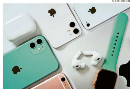
LOS PRODUCTOS DE APPLE SON RECORDADOS POR SUS DISEÑOS.

Este camino fue pavimentado mediante la aparición del computador Macintosh en 1984, que introdujo la informática personal a las masas, hasta el iPod en 2001, que cambió el consu-