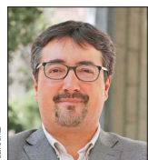
Juan Ignacio Latorre, exsenador.

paros frente a la ampliación del recurso a resoluciones que no ponen término al proceso. Los jueces señalan que la propuesta ampliaría su competencia en materias altamente especializadas. "Cuesta comprender por qué frente a un aparato burocrático robusto, compuesto por un Ministerio del Medio Ambiente, una Superintendencia del Medio Ambiente, un Servicio de Evaluación Ambiental, un Servicio de Biodiversidad de Áreas Protegidas y tres tribunales ambientales, sea, en último término, una sala de la Corte Suprema la que pueda ser llamada a conocer y resolver de todos los conflictos ambientales, especialmente de aquellos que no significan una decisión terminal por parte de la autoridad administrativa", argumentan.