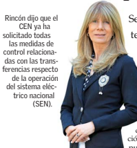
Rincón dijo que el CEN ya ha solicitado todas las medidas de control relacionadas con las transferencias respecto de la operación del sistema eléctrico nacional (SEN).

Secretaría de Estado se pronunció en torno a las reparaciones inminentes que requiere el tendido, en el tramo de La Dormida, por el desgaste de los cables en esa intersección.