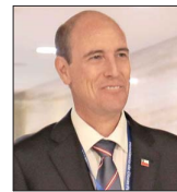
El ministro de Obras Públicas, Martín Arrau.

Consultado si ese "absurdo" también se aplica para la evaluación del impacto "espiritual" de la desaladora de Coquimbo, Arrau señaló que "eso es. Cuando vemos hospitales parados por cinco años o cuando nos piden tener una conexión de la Ru-