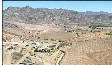
La Región de Coquimbo sufre una extrema sequía desde hace años y la desaladora que impulsa el MOP asoma como una solución.

Los expertos reconocen que tras suscribir tratados internacionales aumentó la participación de comunidades en evaluaciones ambientales.