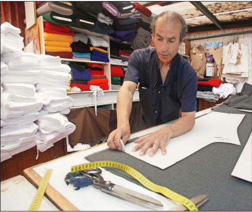
El deterioro del mercado laboral ha golpeado, especialmente, a las micro y pequeñas empresas que tienen hasta 49 trabajadores.

• Especialistas calculan que al trimestre septiembre-noviembre de 2025 en estas firmas de menor tamaño se destruyeron 74.984 puestos de trabajos asalariados formales.