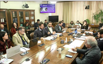
En la segunda semana de enero el Ejecutivo ingresó el proyecto de negociación multinivel para que se empezara a discutir en la comisión de Trabajo de la Cámara.

del Departamento de Derecho del Trabajo y Seguridad Social de la Facultad de Derecho de la Pontificia Universidad Católica.