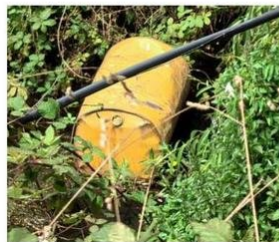
URBANISTAS PONIENTE CON MONTE BLANCO.

BASURA. En algunos tramos del canal el panorama es lamentable. Mantener la limpieza del canal no sólo es responsabilidad de la autoridad sino que también de los habitantes.