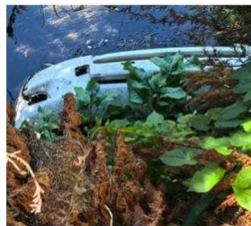
EL VALLE CON EL LLANO. AV. GABRIELA MISTRAL.