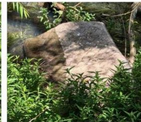
FRENTE AL COLEGIO SCOLE CREARE.