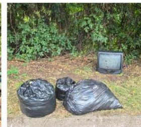
GABRIELA MISTRAL CON ASTURIAS (CATALUÑA).