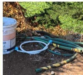
AV. GABRIELA MISTRAL LLEGANDO A LOS NOTROS.