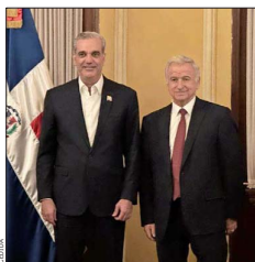
El Presidente de República Dominicana, Luis Abinader, junto a Felipe Larraín.

EL MERCURIO LUNES 22 DE DICIEMBRE DE 2025