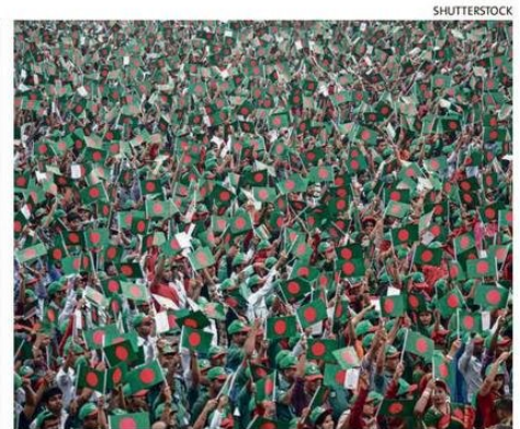
LA ONU OBSERVÓ AUTOCENSURA EN LOS PERIODISTAS.

El fin de año no tiene por qué ser una carrera contra el reloj, sino que “puede convertirse en una oportunidad para recuperar el sentido de pausa y conexión. No significa hacerlo todo, se trata de darse tiempo para descansar, agradecer y empezar el nuevo ciclo con más serenidad”, recomendó la docente a poco más de una semana de Navidad.