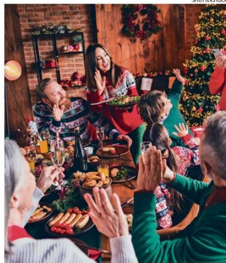
LAS REUNIONES FAMILIARES SON HABITUALES EN DICIEMBRE.

“A veces las reuniones familiares hacen bien y otras no tanto, depende del vínculo que tengamos con las personas”, destacó la académica, junto con recordar que el estrés no sólo se manifiesta en la mente; puede expresarse a través de tensión muscular, fatiga, alteraciones del sueño o dificultades para concentrarse.