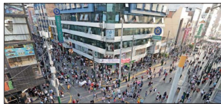
El año pasado, la economía del país vecino creció un 3,3%.

10,01% en el trimestre de julio a septiembre 225, impulsada por el avance de la construcción. Ese sector se expandió 6,4% por la mayor ejecución de obras públicas y privadas, según información oficial.