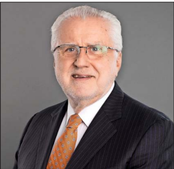
Máximo Pacheco, presidente de Codelco.

Ahora solo resta la toma de razón de los contratos Corfo con la filial de litio de Codelco, Minera Tarar, por parte de la Contraloría General de la República (CGR). Los documentos ingresaron en septiembre a la Contraloría, y la entidad no tiene un plazo determinado para finalizar su revisión, aunque se espera que esté el visto bueno dentro de noviembre.