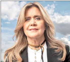
Gina Ocqueteau, presidenta de SQM.