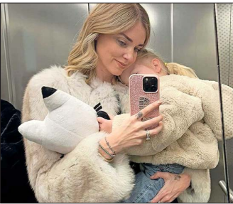
La influencer italiana Chiara Ferragni tiene 28 millones de seguidores en Instagram. Esta semana compareció por un juicio de estafa por hacer campañas promocionales engañosas.

En Chile, el Servicio de Impuestos Internos comenzó a fiscalizar a los generadores de contenido por los ingresos obtenidos. Comenzó como un plan piloto en 2022 y en 2025 ya se ha clasificado a 31 mil personas co-