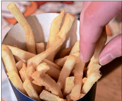
La comida rica en grasa activa en el cerebro mecanismos que generan más apetito, advierten los expertos.

Y agrega: "La evidencia científica muestra que estos factores no controlados alteran la regulación de la grasa a nivel cerebral y, en forma secundaria, generan hormonas que dan más hambre y