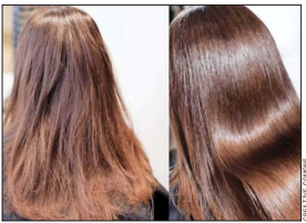
El glass hair se caracteriza por un pelo liso y muy brillante.

Aunque el clean look concentra gran parte de las consultas, aseguran los médicos, el wet look , que da la